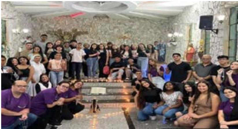
Comunidade de Itaquaquecetuba, São Paulo, Brasil.