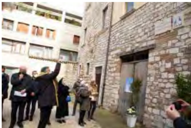
Alcuni momenti della cerimonia della benedizione della targa dedicata a Madre Tecla Relucenti