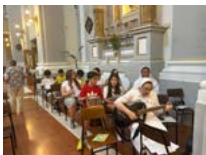
Animazione della S.Messa in parrocchia a Colonnella