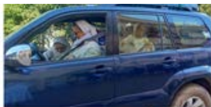
La Madre Generale nella comunità di Ambaiboho