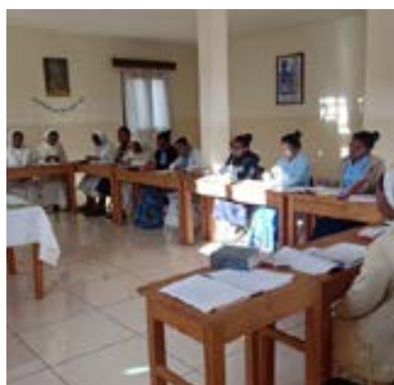
Incontro di formazione e dialogo nella Visita Canonica