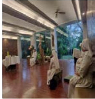
Annual Spiritual Retreat