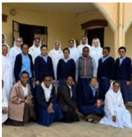
La comunità di formazione a Antananarivo al completo