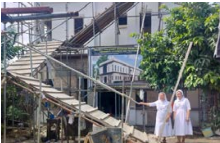
I lavori per la Casa dello studente e della donna delle Suore Pie Operaie dell'Immacolata Concezione nelle Filippine