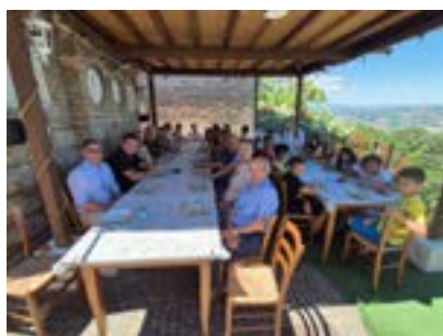
Pranzo conclusivo con la presenza delle famiglie dei ragazzi