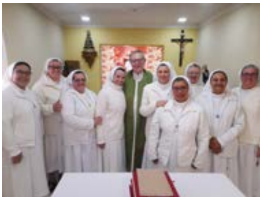
S. Paolo - 14 luglio 2025 - Inizio del Corso degli Esercizi spirituali delle nostre sorelle del Brasile