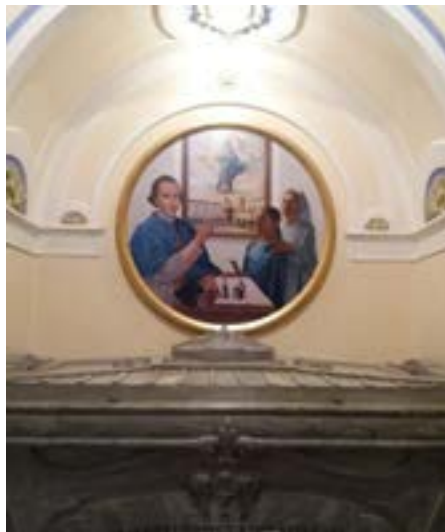
Tomba del Venerabile presso la Chiesa dell’Immacolata ad Ascoli Piceno