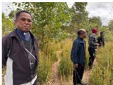
La Madre ha incontrato il nuovo Vescovo della Diocesi di Ambaibobo, ha accompagnato la Madre e le suore a visitare un villaggio della sua diocesi dove vorrebbe aprire una scuola.