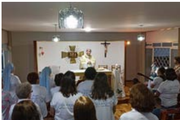
Celebrazione del vescovo nella Cappella della comunità di Cascavel Brasile