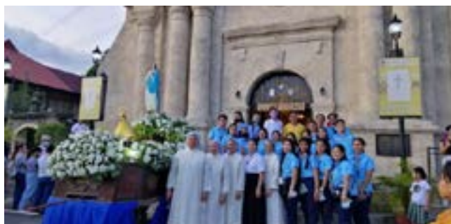
Pronti per la processione dell'Immacolata - Filippine