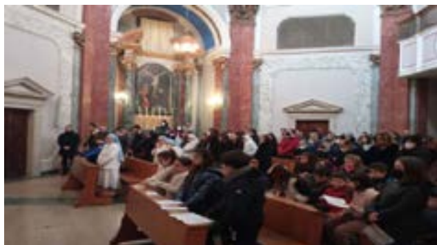
La celebrazione del vescovo di Ascoli Piceno Mons. Gianpiero Palmieri alla presenza degli alunni e delle loro famiglie