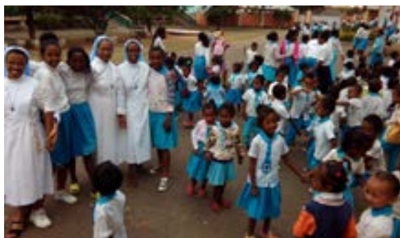
Momenti di festa nel cortile della scuola di Ambaiboho