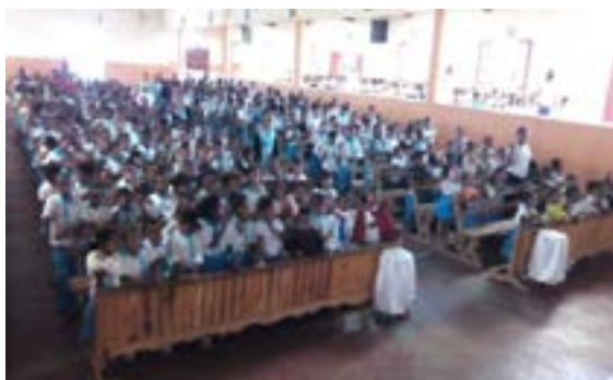
Santa Messa nella parrocchia di Ambaiboho in Madagascar con la partecipazione degli alunni della scuola