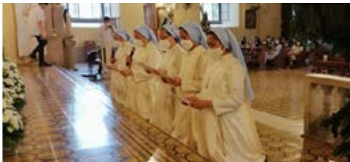
Rinnovazione dei voti delle nostre suore a Calaca Filippine