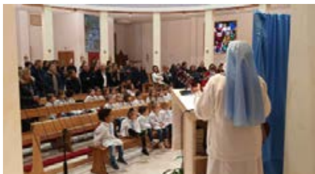
L'Immacolata a S.Egidio alla Vibrata (TE)