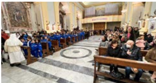
I bambini e le famiglie della Scuola di S.Benedetto del Tronto (AP)