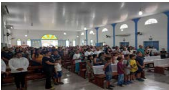
Celebrazione dell'Immacolata a Barra do Garca Brasile