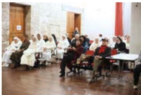
Il coro "F.A.Marcucci" canta l'Inno al Padre Fondatore